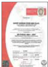
OHSAS 18001:2007 Gestione della salute e della sicurezza sul lavoro