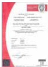
ISO 9001:2008 Gestione della qualità

Un punto di riferimento mondiale per la produzione di valvole e accessori Saint-Gobain PAM Italia, grazie alla sua attenzione alla qualità del prodotto e del servizio erogati, al rispetto dell'ambiente in tutti i processi produttivi attivi, nonché alla sensibilità verso la salute e la sicurezza dei lavoratori.