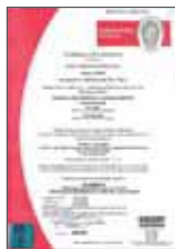
EN 1074:2001 Certificato di prodotto