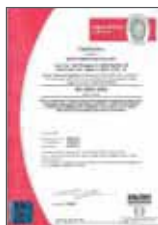
ISO 14001:2004 Gestione ambientale